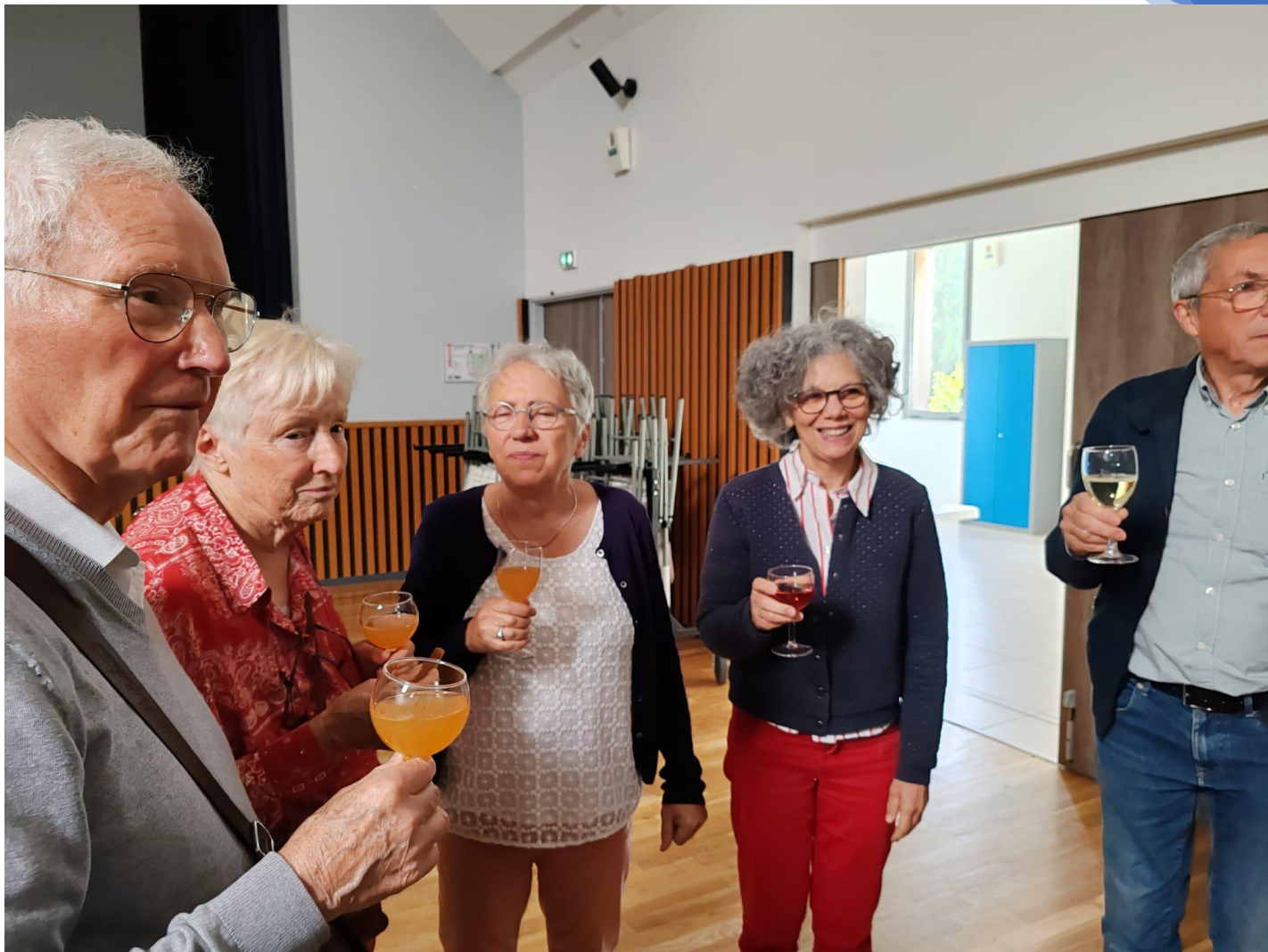
12h00 : apéritif