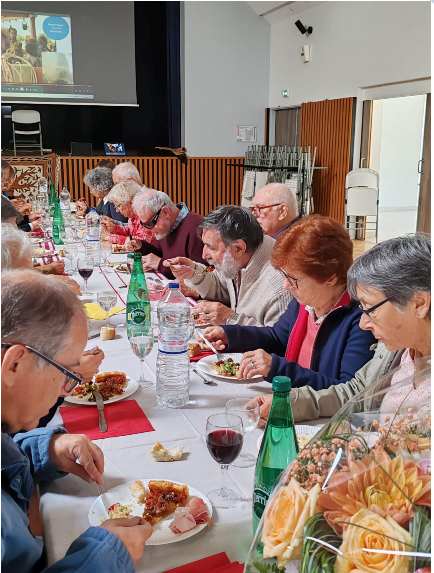
Le repas : merci à « toutes les petites mains » pour toutes ces préparations et ces douceurs.