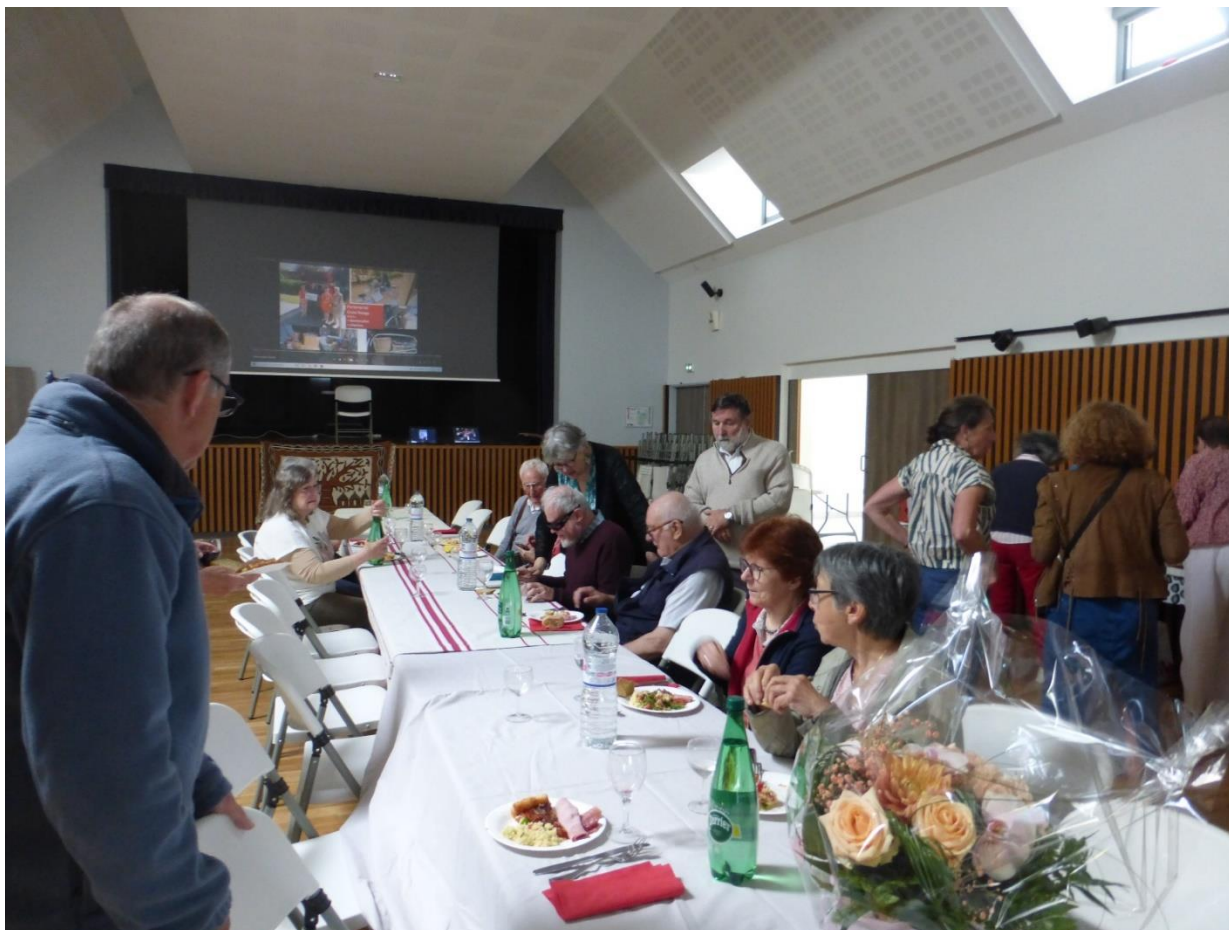
Quelques délices sucrés précédant la préparation de la salle pour l'intervention.