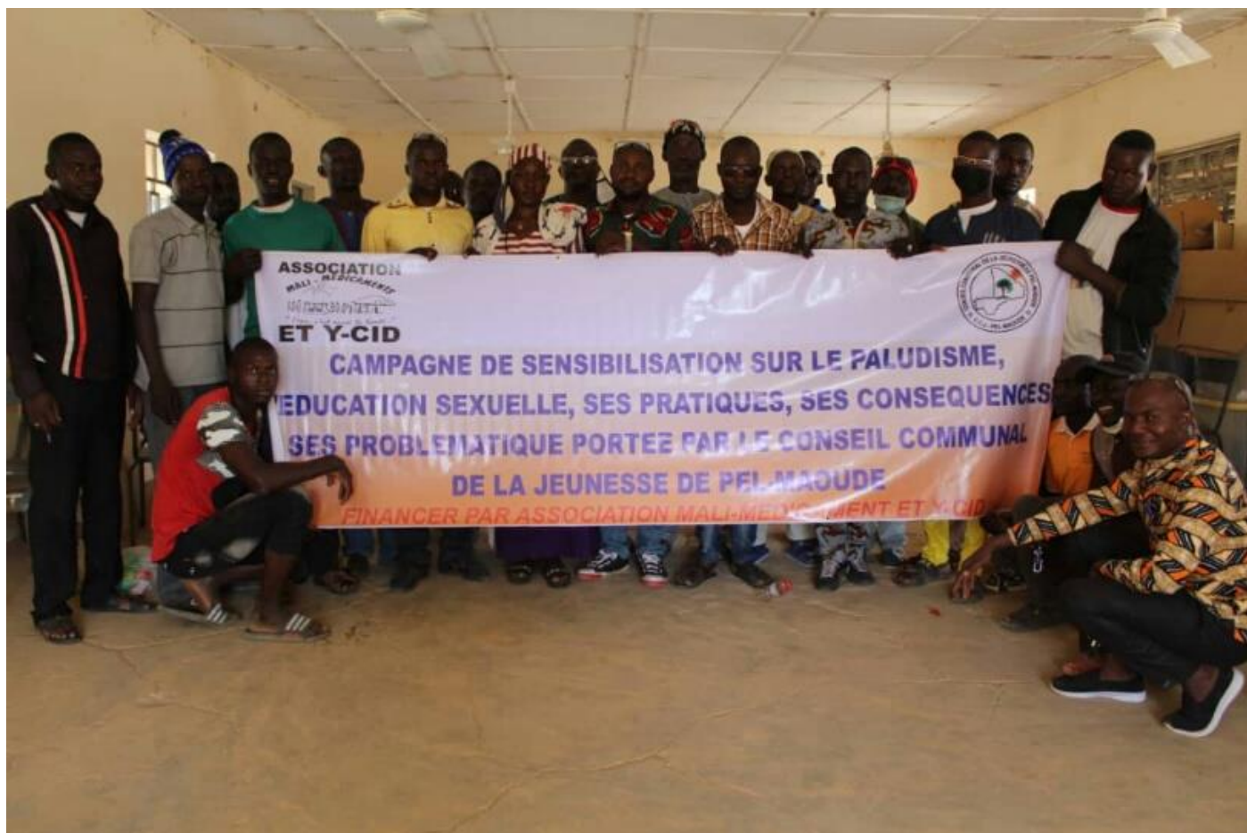
Financement 2 ème phase, remise du chèque le 23 décembre 2021 par le Maire notre correspondant au vice-président du CCJP :