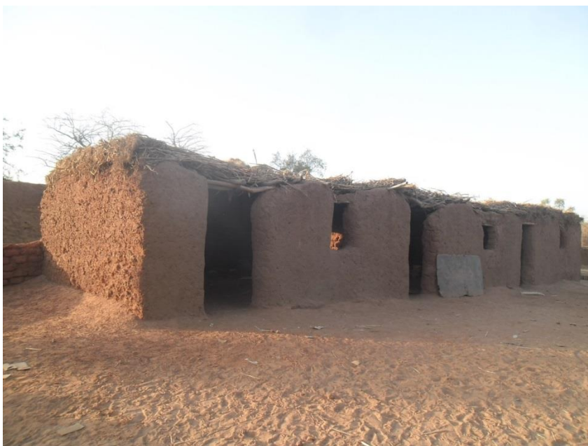
Des salles de classe :

Photos prises mi-janvier 2019 : Vue d'ensemble de l'école franco-arabe