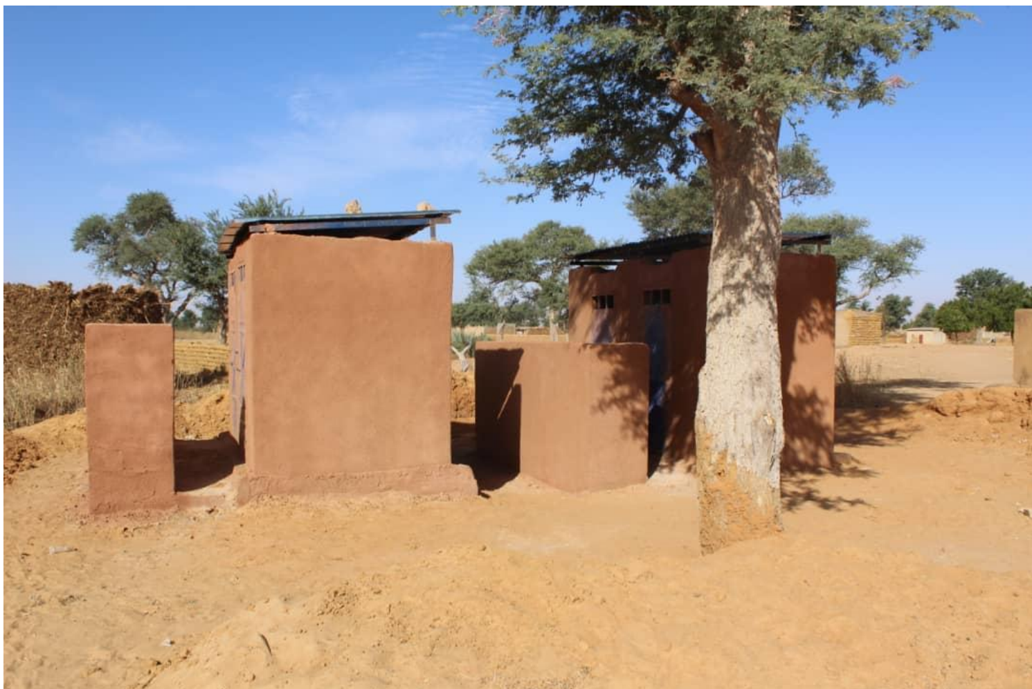
Latrines de l'école publique cycle II de Pel-Maoudé achevées le 6 décembre 2019. Les primaires retrouvent l'usage de leurs deux blocs de latrines séparées filles- garçons et les 328 élèves du secondaire bénéficient pleinement de ces nouvelles installations.