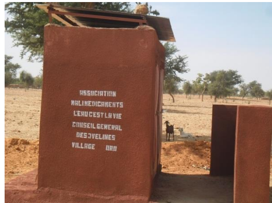
Photos latrines de Karama et d'Oro