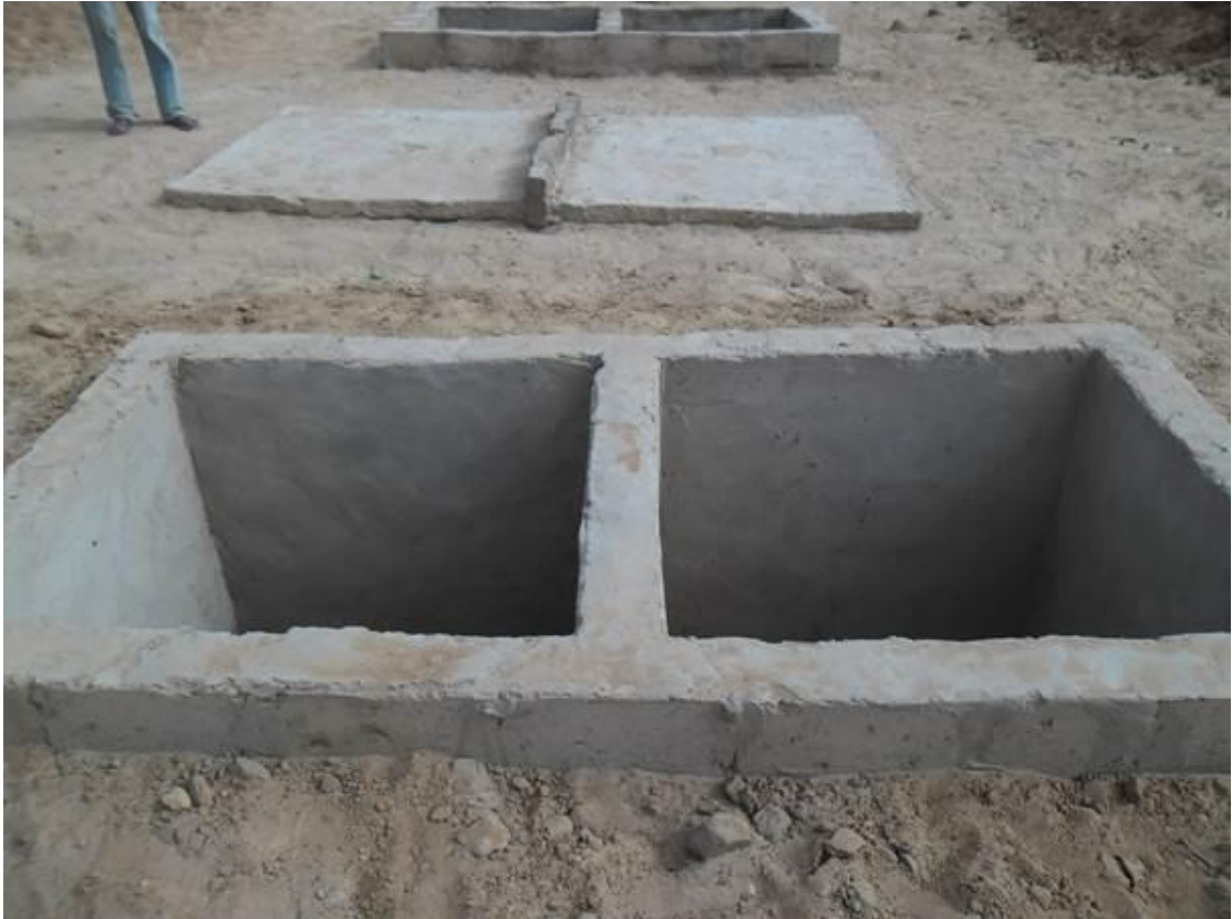
Photos de la fosse : ensemble de deux cuves à deux compartiments raccordées aux quatre cabines