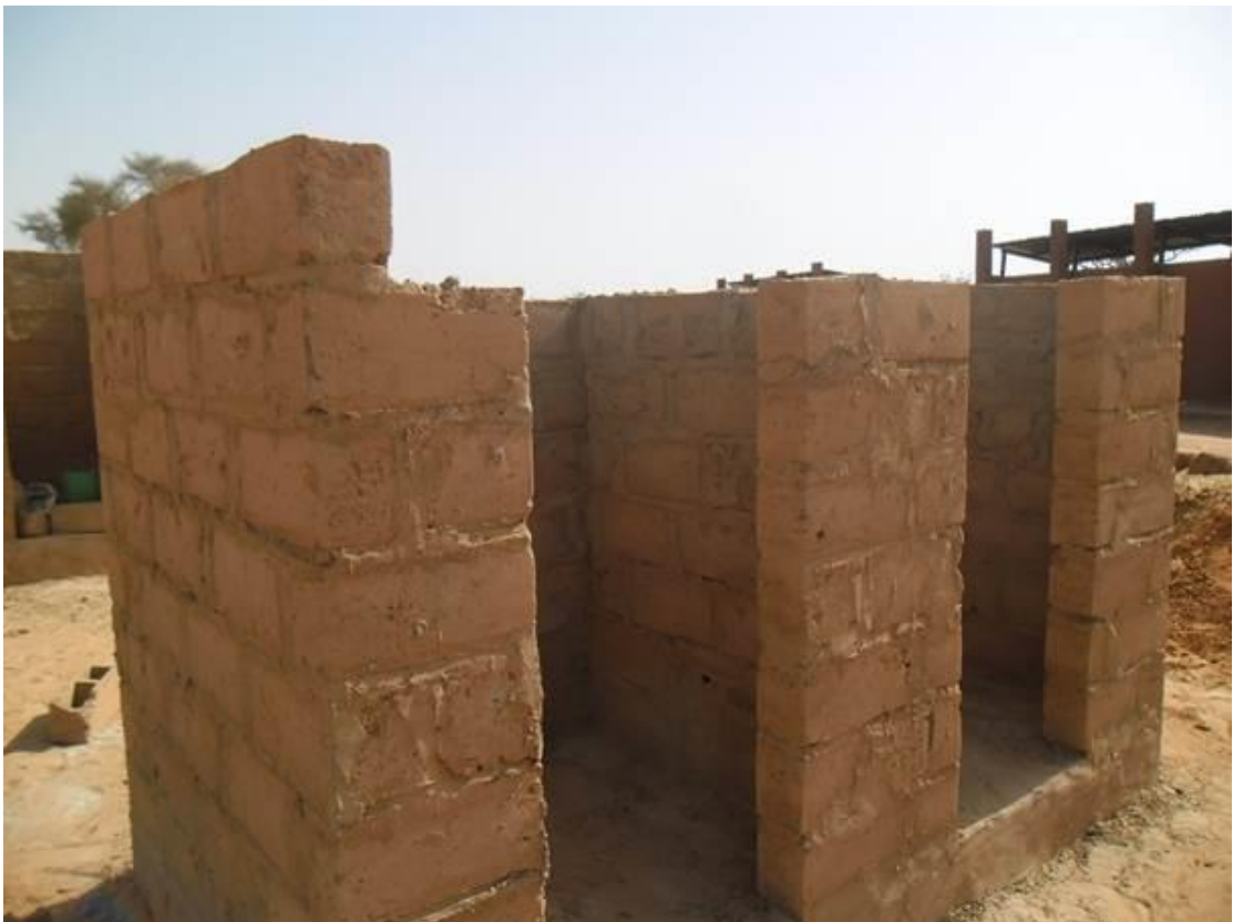
Bloc de deux cabines en construction, les parpaings sont fabriqués sur place.