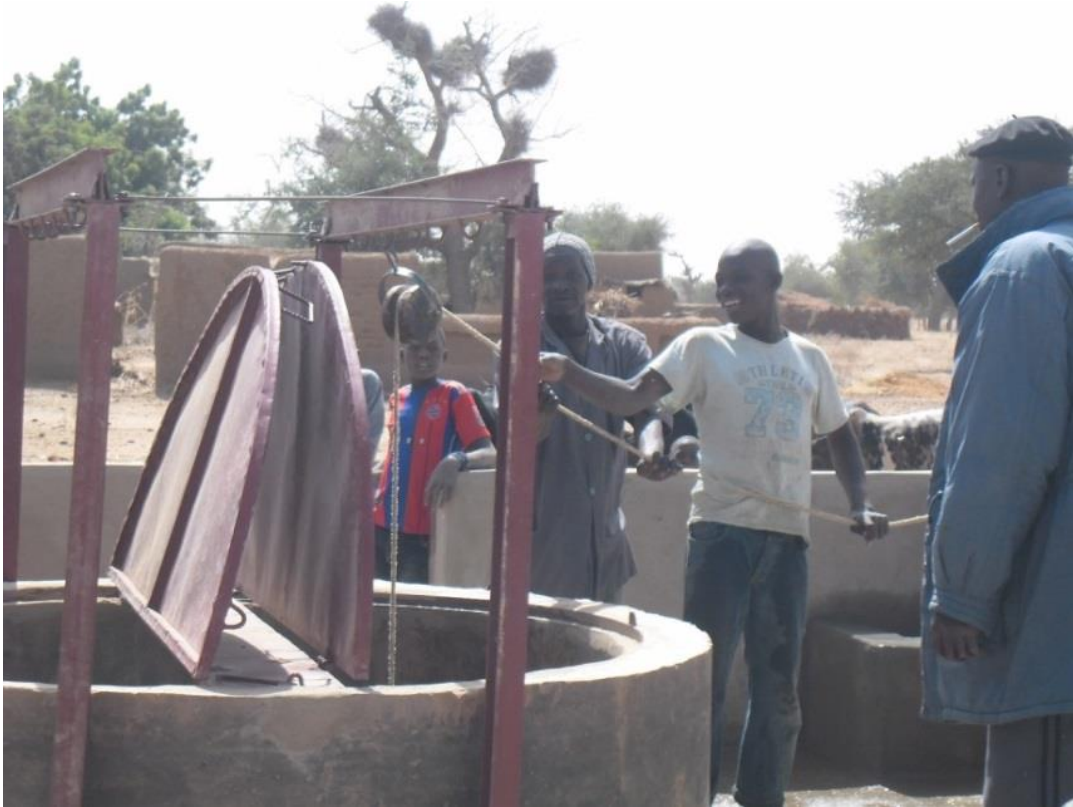
En fonction pour les fêtes de fin d'année 2014, un beau cadeau de Noël !