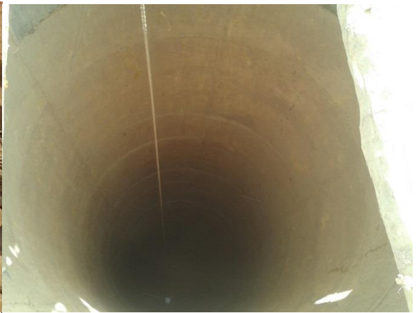
Surcreusement sur 6m de profondeur Fin novembre 2014