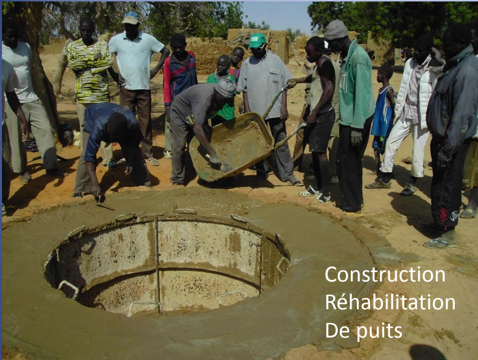
Construction Réhabilitation De puits