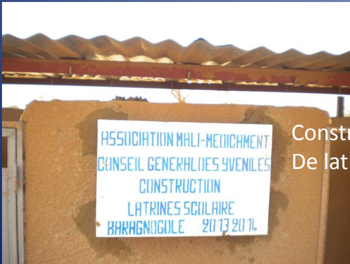
Construction De latrines