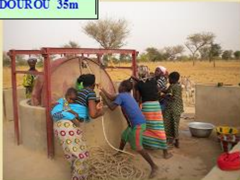
2013: GUIDOUROU 35m