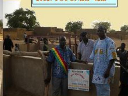
2012: TOUGNIRI 42m