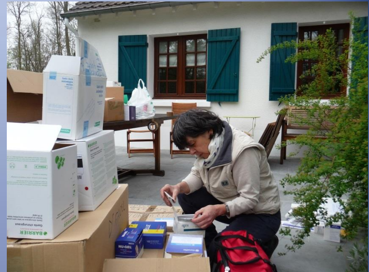
Aides aux soins