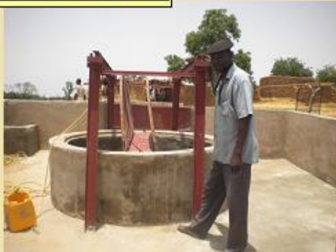
2012: MONIBOURO 35m