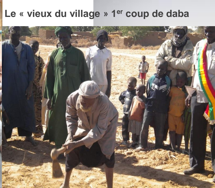
Le « vieux du village » 1 er coup de daba