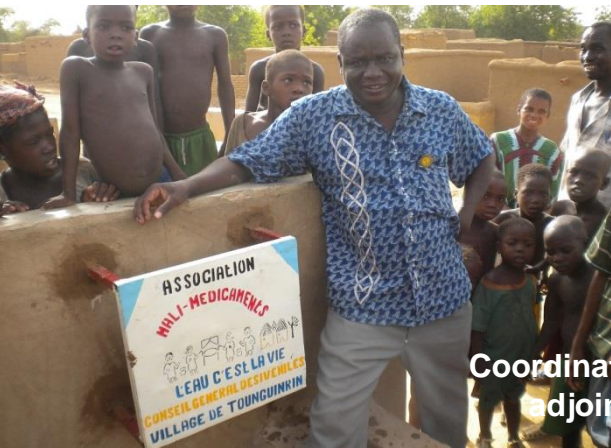
Coordinateur programme puits, latrines cercle de KORO, 1 er adjoint au Maire, Econome Paroisse de Pel-Maoudé