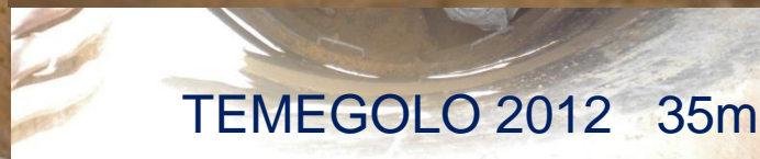
TEMEGOLO 2012 35m de profondeur